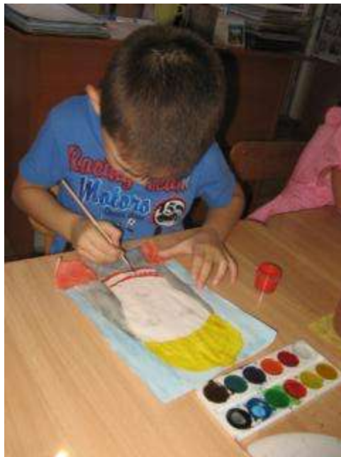
Рисуем богатырей русских