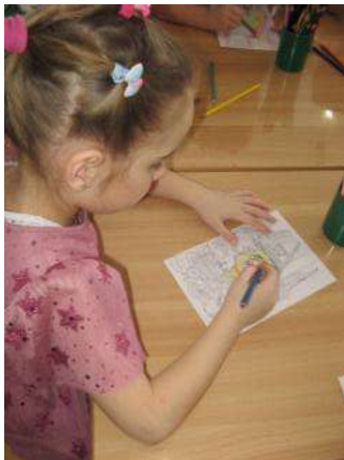
Хохломские узоры выводим