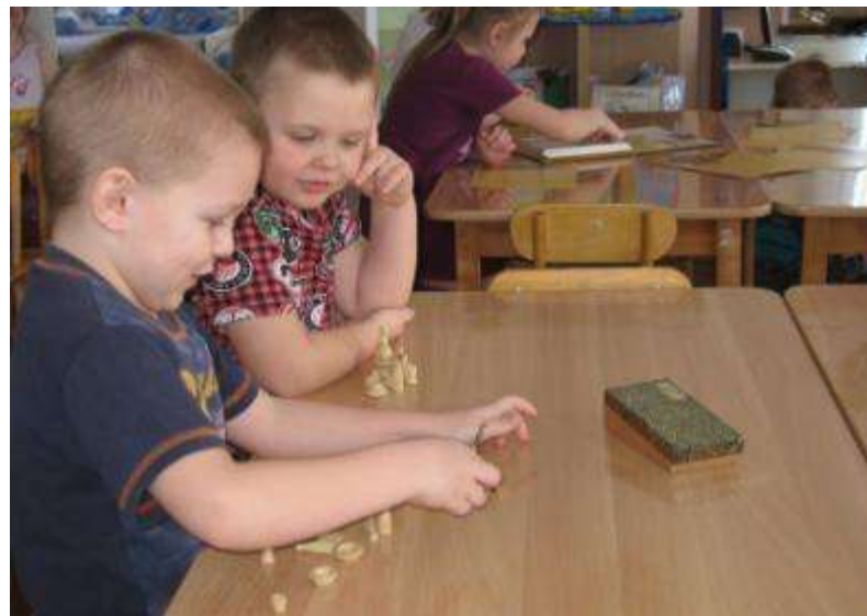
Ох и непросто играть в «Бирюльки»