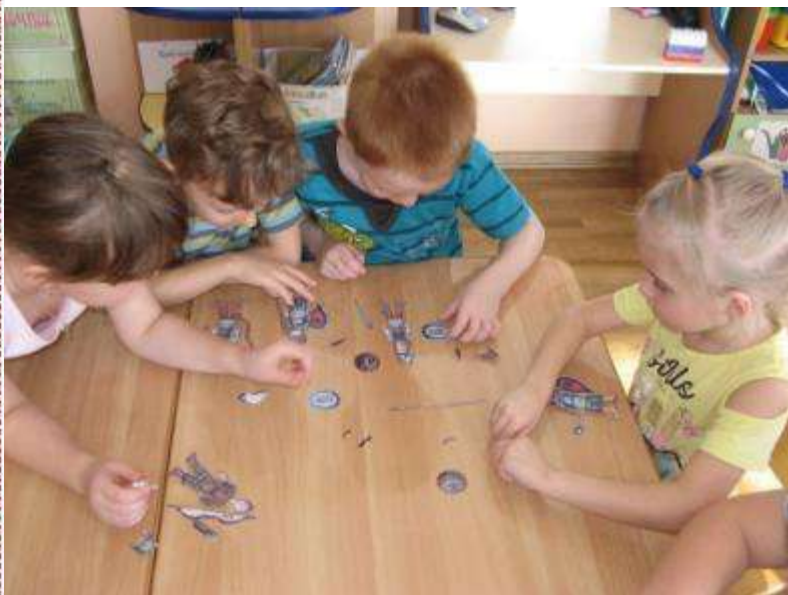
Собираем богатырей на бой ратный