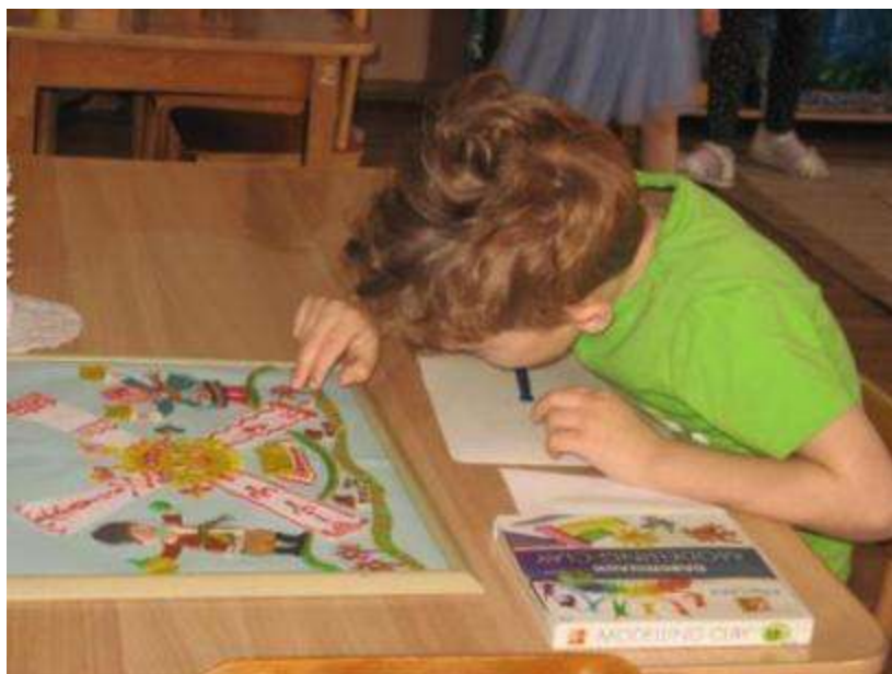
Ювелирная работа из пластилина.