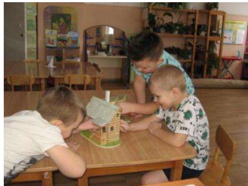
В игровом пространстве «Русская изба» разбираемся как жили наши предки